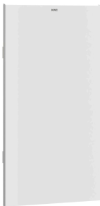
Pannello frontale con vetro ESG bianco EXOS. 2030025234 ZEXOS605W