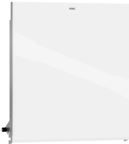
Pannello frontale con vetro ESG bianco EXOS. 2030034672 ZEXOS600EW