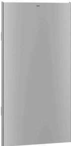
Pannello frontale in acciaio inox EXOS. 3600008765 ZEXO605