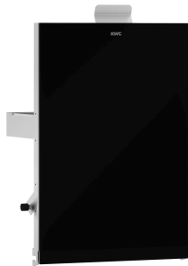
EXOS. Front z czarnym szkłem ESG

Aksesoria łazienkowe | Pojemniki na odpady higieniczne