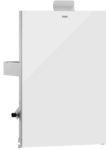
Parte frontal con cristal ESG blanco EXOS.