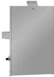
Parte frontal de acero de cromo-níquel EXOS.

Modell-Linie: EXOS | EXO611EB | 3600008910 | EAN/GTIN: 7612987160023 Accesorios | Papelera para envases de higiene