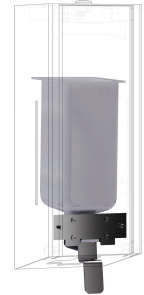
EXOS. Umrüstkit für Flüssigseifenspender