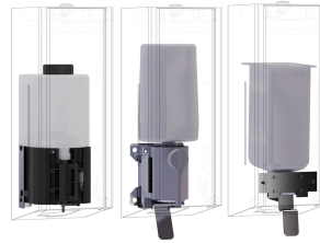
EXOS. Umrüstkit für EXOS. Seifenspender