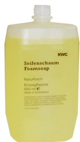
Cartucho de jabón en espuma