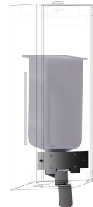
Kit de conversión para dispensador de jabón líquido EXOS.