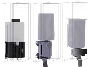
EXOS. Konverteringssats för automatisk tvåldispenser