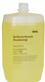
Foam soap cartridge