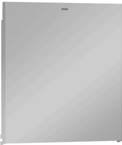
Pannello frontale in acciaio inox EXOS. 3600008927 ZEXO600E