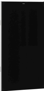
Pannello frontale con vetro ESG nero EXOS. 2030022931 ZEXOS605B