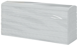
Salviette asciugamani piegate 2030072378 FH70P