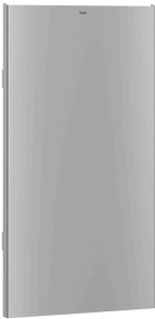
Pannello frontale in acciaio inox EXOS. 3600008765 ZEXO605