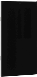
Pannello frontale con vetro ESG nero EXOS. 2030022931 ZEXOS605B