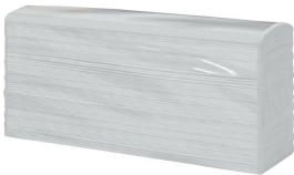
Salviette asciugamani piegate 2030072378 FH70P