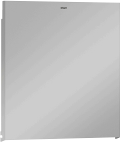
Pannello frontale in acciaio inox EXOS. 3600008927 ZEXO600E

Modell-Linie: EXOS | EXO602EW Accessori | Combinazioni